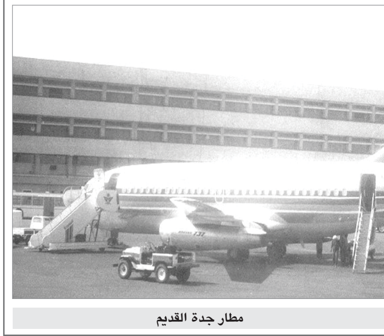
مطار جدة القديم

كما شهده رؤساء البعثات السياسية واعضاء السلكين الدبلوماسي والقنصلي. واعيان البلاد وابناء الجالية الافغانية. وبعد ما تناول المدعون طعام العشاء عرض فيلم سينمائي يمثل نهضة افغانستان ومظاهر تقدمها في مختلف مرافق الحياة. هذا وكان سعادة السفير يتولى بنفسه استقبال المدعوين والقيام على خدمتهم والعناية بهم مما ترك في نفوسهم اطياب الاثر وابلغه.