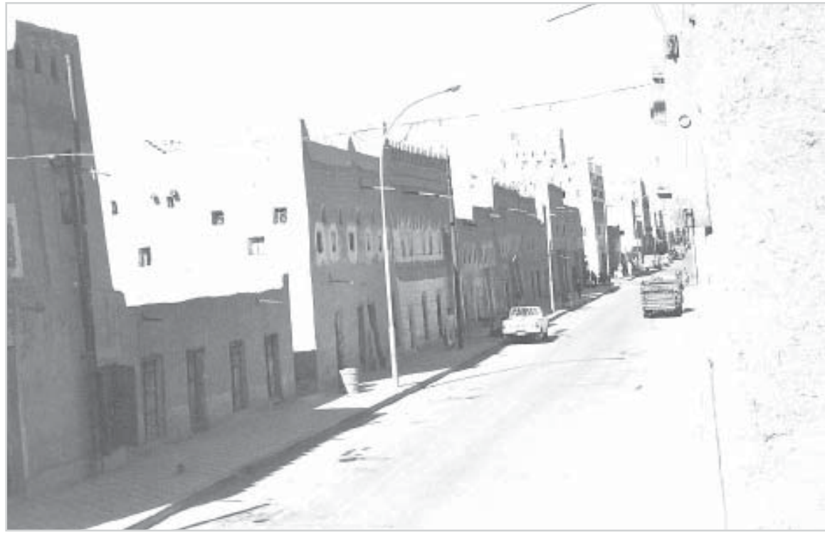
من شوارع نجران