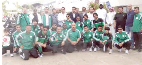
الرياض - البلاد