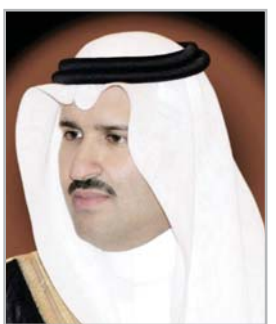
فيصل بن سلمان

فيها من خلال موقع خاص للتوظيف على الإنترنت. وأشار الحمدي إلى أن الغرفة التجارية الصناعية ممثلة في إدارة البحوث والدراسات أجرت دراسة احصائية للمتقدمين للتوظيف والوظائف المطلوبة عبر موقع التوظيف الإلكتروني حيث أوضح الفرز الإلكتروني بأن الوظائف المطلوبة قاربت ال ( ٧٠٠ ) وظيفة بلغ عدد الجامعيين ( ٨٥ ) جامعيًا