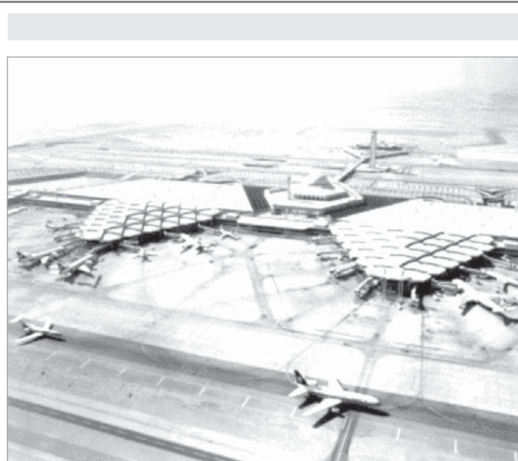
مطار الرياض - ١٩٧٨ م

مناقشة لوحات اسماء الشوارع في العاصمة المقدسة تم رسوها على احد المقاتلين.