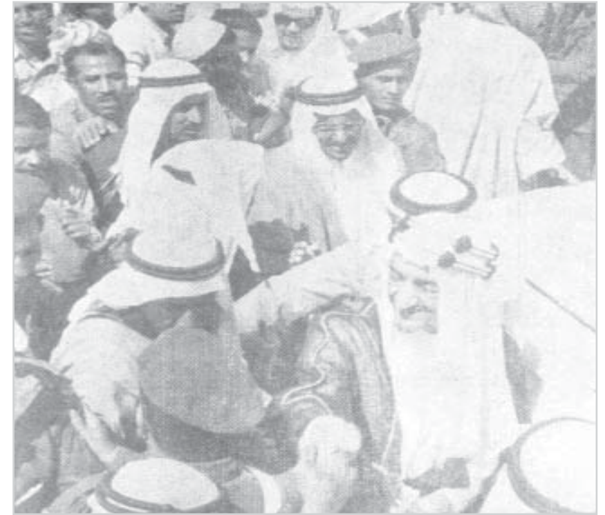
صاحب السمو الملكي الأمير فيصل يستمع إلى مطالب الشعب في الاحساء - ١٢٨٢ هـ

هذه المواد نشرت بتاريخ 18 - 10 - 1382 هـ 14 / 3 / 1963 م