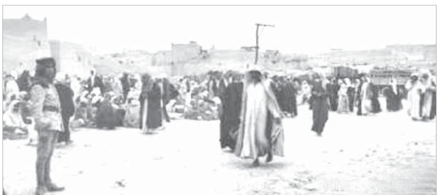
جانب من مدينة الرياض - ١٩٤٢ م