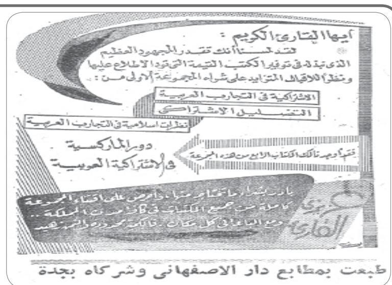
طبعت بمطابع دار الاصفهاني وشركاه بجدة

استغلت وزارة الحج الآبار المنتشرة في البلد لتزويد المبيضاءات بمياهها .. وكانت الآبار في حكم المغفلة.