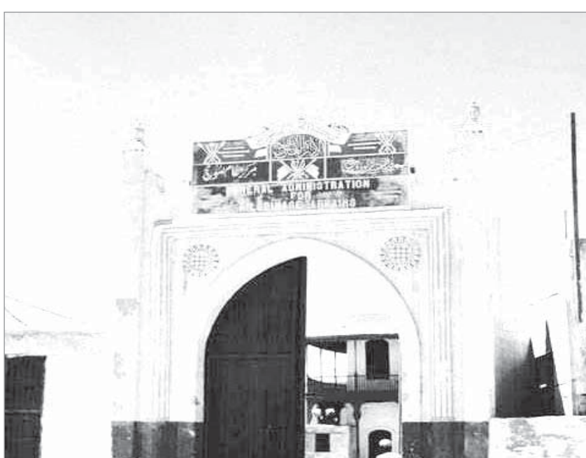
بوابة جدة ونقطة التفقيش آنذاك للقادمين اليها ١٩٤٧ م

جمعيات للتاريخ والرياضة والانجليزي تم احداثها للطلبة بالمدرسة الرحمانية المتوسطة.. هدفها تقوية الطلبة في هذه المواد خلال الفترة الباقية من الموسم الدراسي لهذا العام.